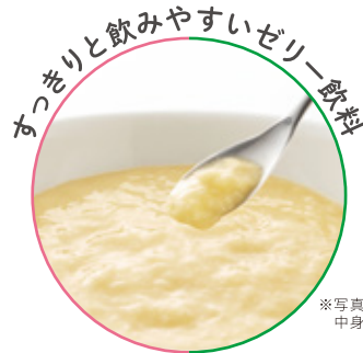
※写真はもも風味の 中身のイメージです