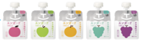
もも味 青りんご味 みかん味 マスカット味 赤ぶどう味

水分とエネルギー100kcalを同時に補給できる「エンガード水分補給ゼリー」も好評発売中!